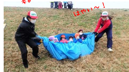
大人気！ グレーシートすべり！

毎年恒例、土手すべり、たこあげ。小学生は、「むかしあそび」も楽しみました。寒くても体を動かして遊べば、からだもぼかぼか