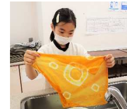
個性的な作品ができました